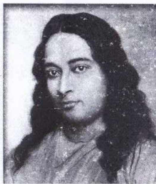
(ଜାନୁଆରୀ ୫, ୧୮୯୩ - ମାର୍ଚ୍ଚ ୭, ୧୯୫୨)

ସ୍ଵାମିନିଃ ସତ୍ୟମ୍ ସନ୍ତୁଷ୍ଟିତଃ ସନ୍ନିତଃ ସଦାବ୍ୟୟ ସର୍ବମ୍ ସଂସାରମ୍ ।